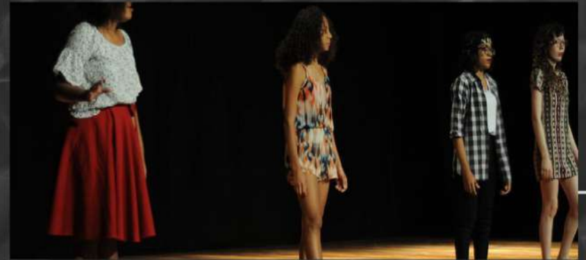
Encontro das artes 2018 Esquete: A mulher que sou.