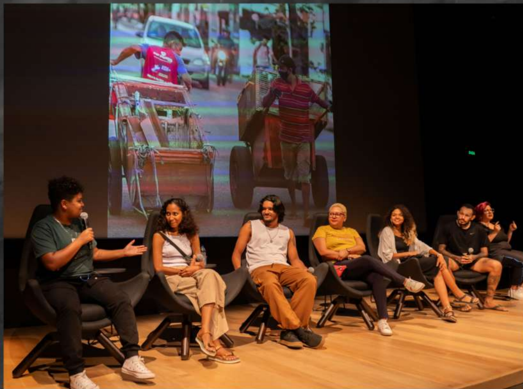
Projeto: Olharte: fotografia, rima e poesia. Roda de conversa Pinacoteca do Ceará- 2023