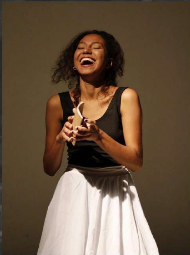
Ensaio Fotografia de Espetáculo. Espaço Rastilho. Teatro e dança.