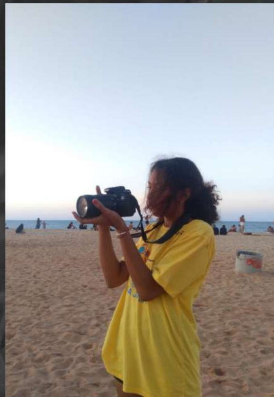
Apresentação e reportagem