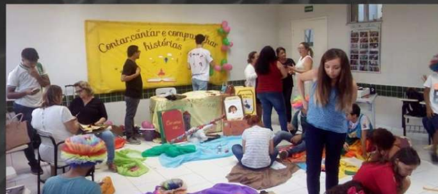
Oficina Contação de história III Jocal - UECE